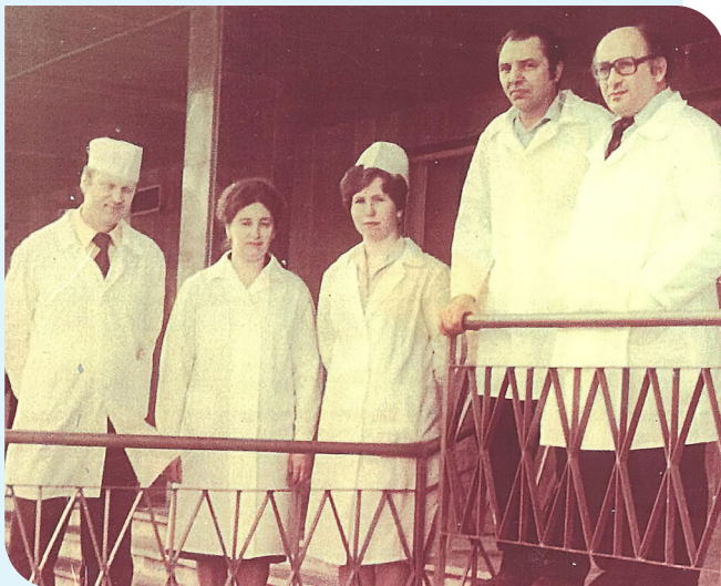
В первые годы работы МСЧ обслуживала 82 000 жителей области, из них 32 000 — в Тюмени