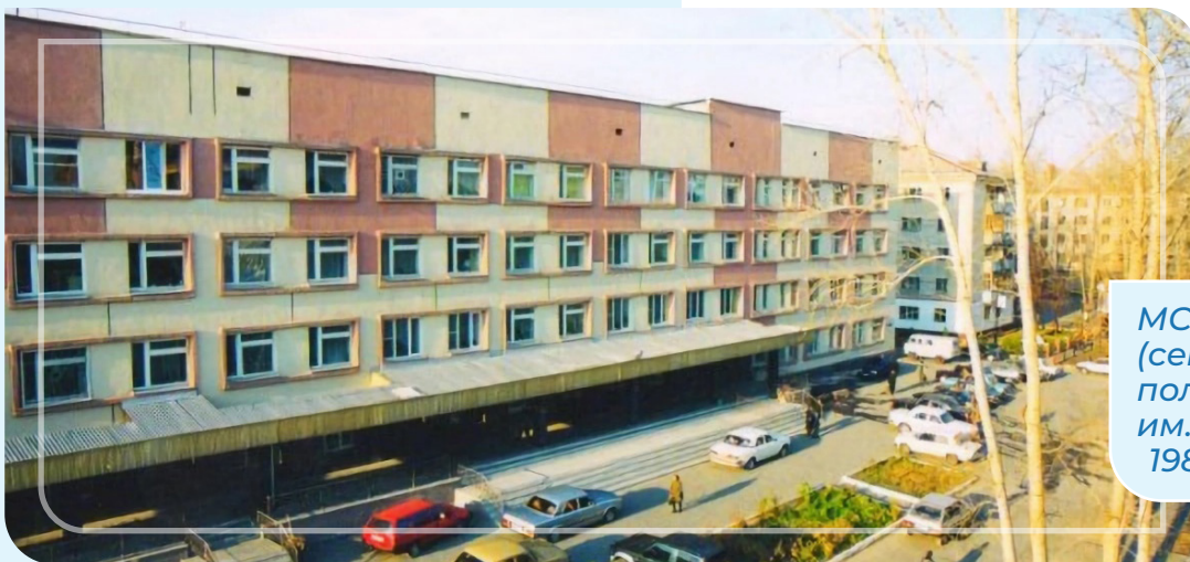
МСЧ «Геолог» (сегодня — поликлиника им. Нигинского), 1980-е гг.